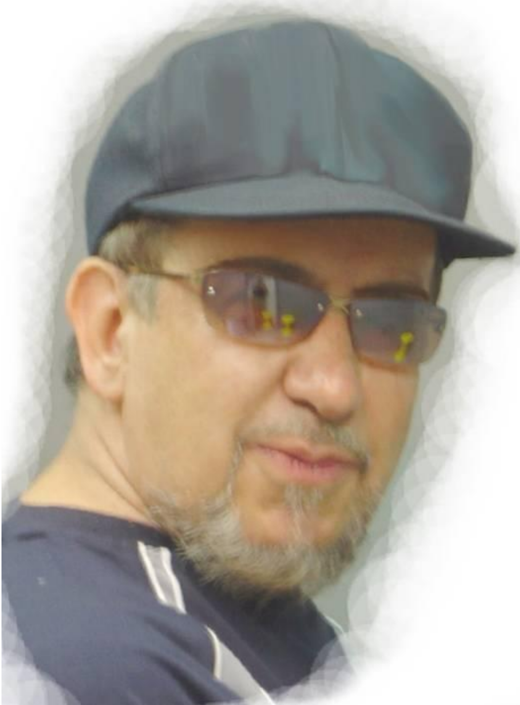
MAGNUM AÑO 2008 (a los 67 años de edad) Nacionalidad de Magnum: mondcvitano