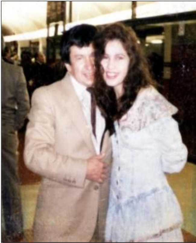
DÉCADA 1975 A1985